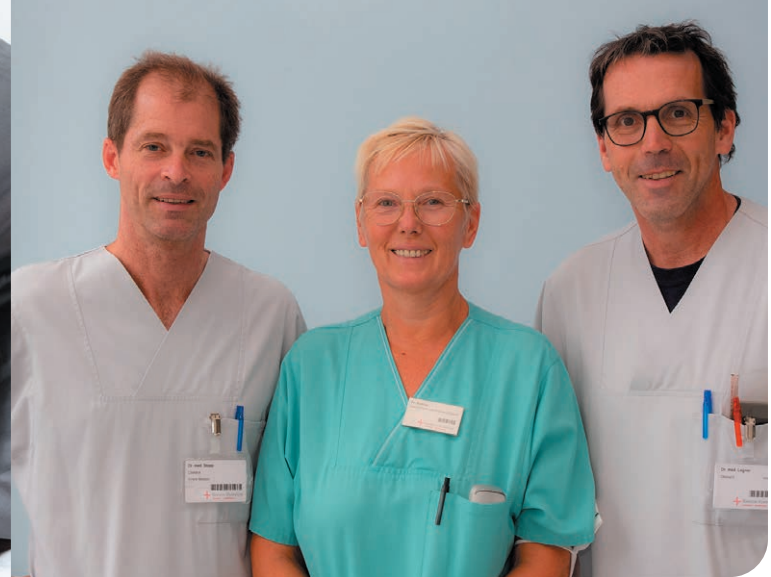
Unser Team im Schlaflabor