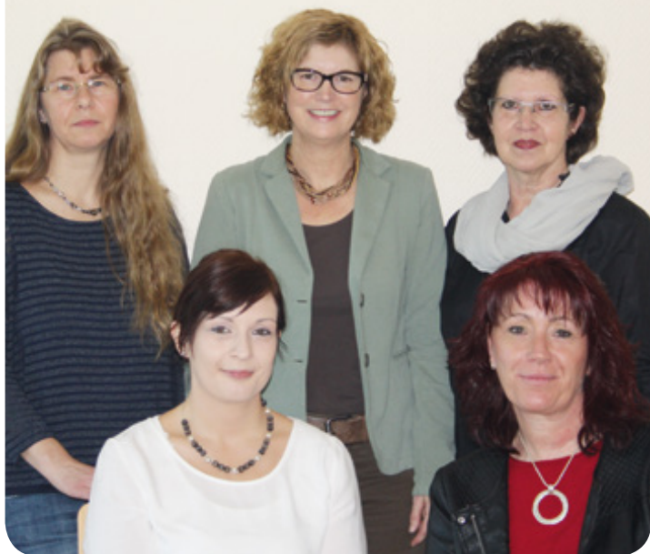
Das Team der Koordinierungsstelle für pflegerische und soziale Hilfsangebote